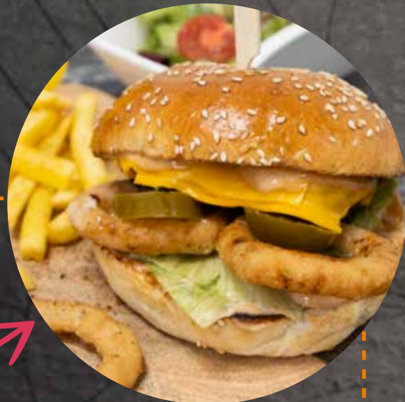
BURGER DU MOIS | DES MONATS

VEGGIE Tous nos burgers sont disponibles avec un steak végétarien Alle unsere Burger sind auch mit einem vegetarischen Steak erhältlich