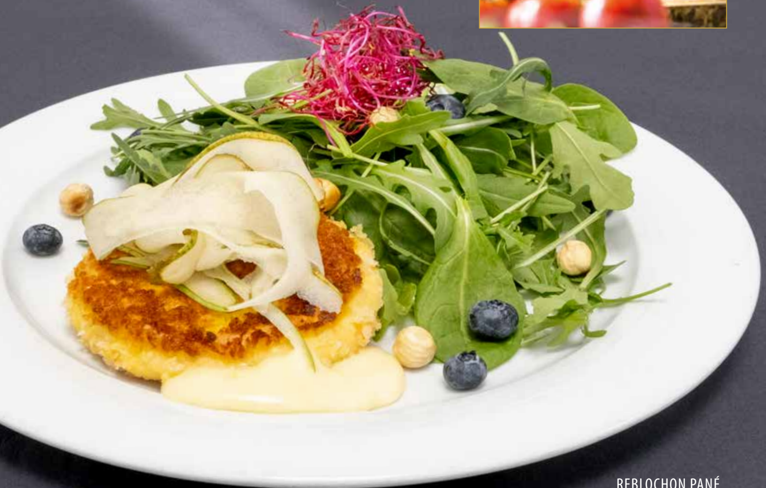
REBLOCHON PANÉ PANIERTER REBLOCHON