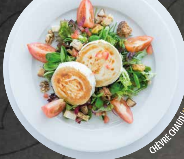
CHÈVRE CHAUD | WARMER ZIEGENKÄSE

Supplément poulet | Aufpreis mit Poulet 2.50