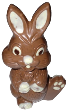
Toni (Lait / Noir / Blanc*)