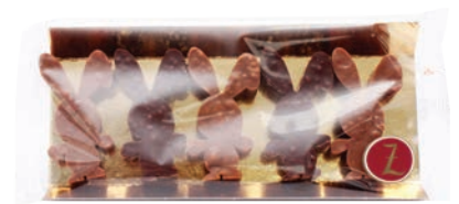
5 petits lapins