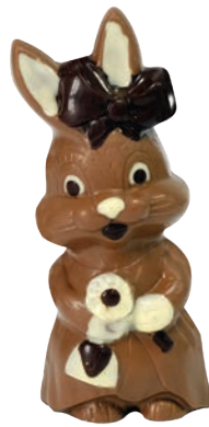
Susi (Lait / Noir / Blanc*)