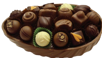
Oeuf Demi (Lait / Noir)