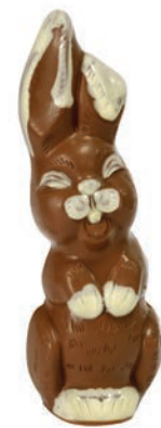
Bunny (Lait / Noir / Blanc*) dès Fr. 10.50