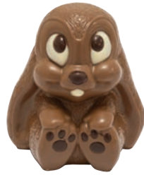
Sweety (Lait / Noir / Blanc*) Fr. 8.90