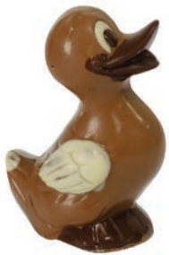
Mimi (Lait / Noir / Blanc*) Fr. 10.50