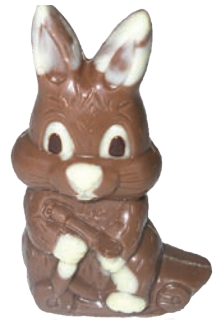
Jimmy (Lait / Noir / Blanc*) Fr. 4.90