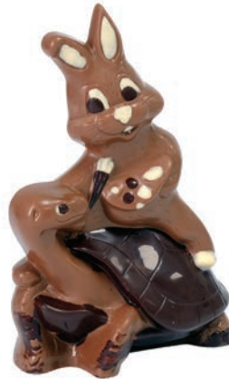
Alex (Lait / Noir / Blanc*)