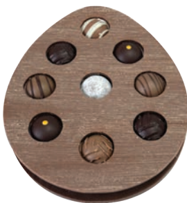
Boîte œuf en chocolat 9pcs