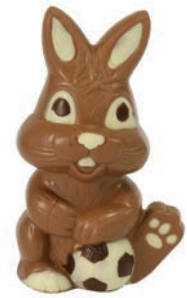
Speedy (Lait / Noir / Blanc*) Fr. 10.50