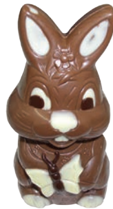
Lidi (Lait / Noir / Blanc*) Fr. 10.50