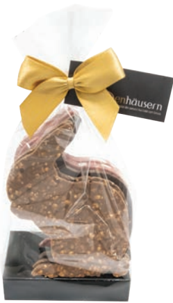
Lapins croquants Fr. 8.90 (Lait-riz soufflé, noir-canneberge, ruby-amandes grillées)