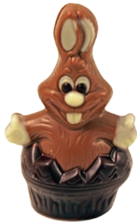
Calimero (Lait / Noir / Blanc*)