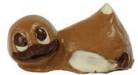
Pô (Lait / Noir / Blanc*) Fr. 6.90