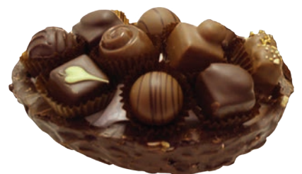
Oeuf Rocher (Lait / Noir)