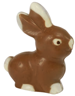
Luca (Lait / Noir / Blanc*)