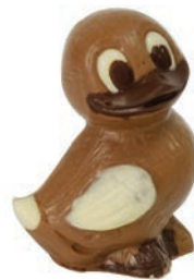
Lala (Lait / Noir / Blanc*) Fr. 6.90