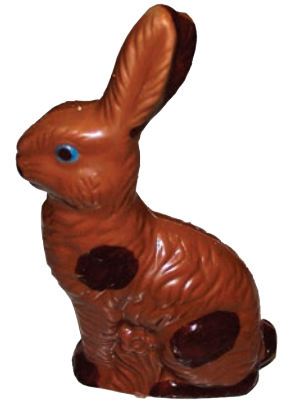
Pierrot (Lait / Noir / Blanc*)