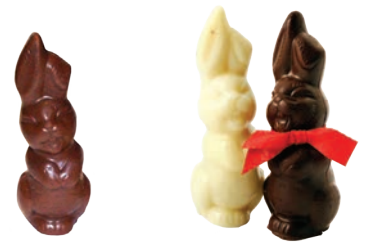
Lapin mini vide / Lapin couple dès Fr. 2.80