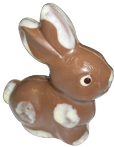
Pablo (Lait / Noir / Blanc*) Fr. 7.90