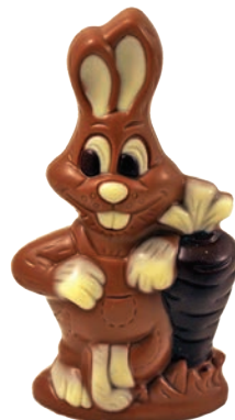
Bugs Bunny (Lait / Noir / Blanc*) Fr. 6.90