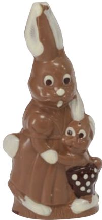
Elodie (Lait / Noir / Blanc*)