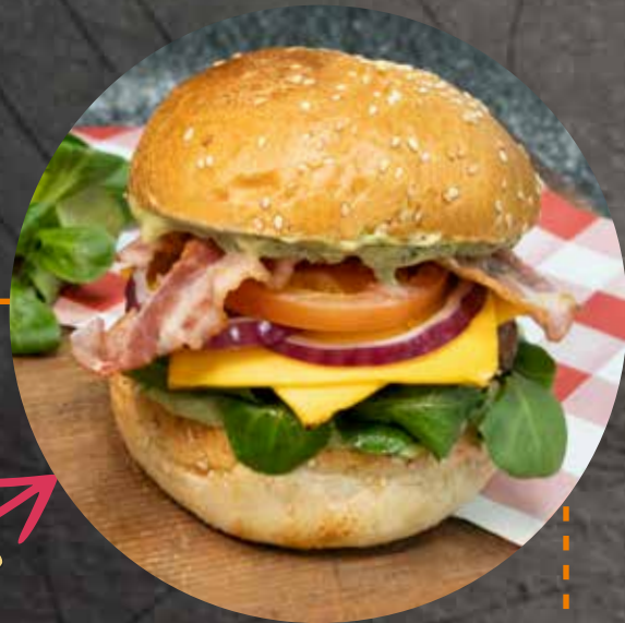
BURGER DU MOIS | DES MONATS

Bœuf, tomate, cheddar, oignons frits, salade et sauce américaine Rindfleisch, Tomaten, Cheddar, Röstzwiebeln, Salat und amerikanische Sauce