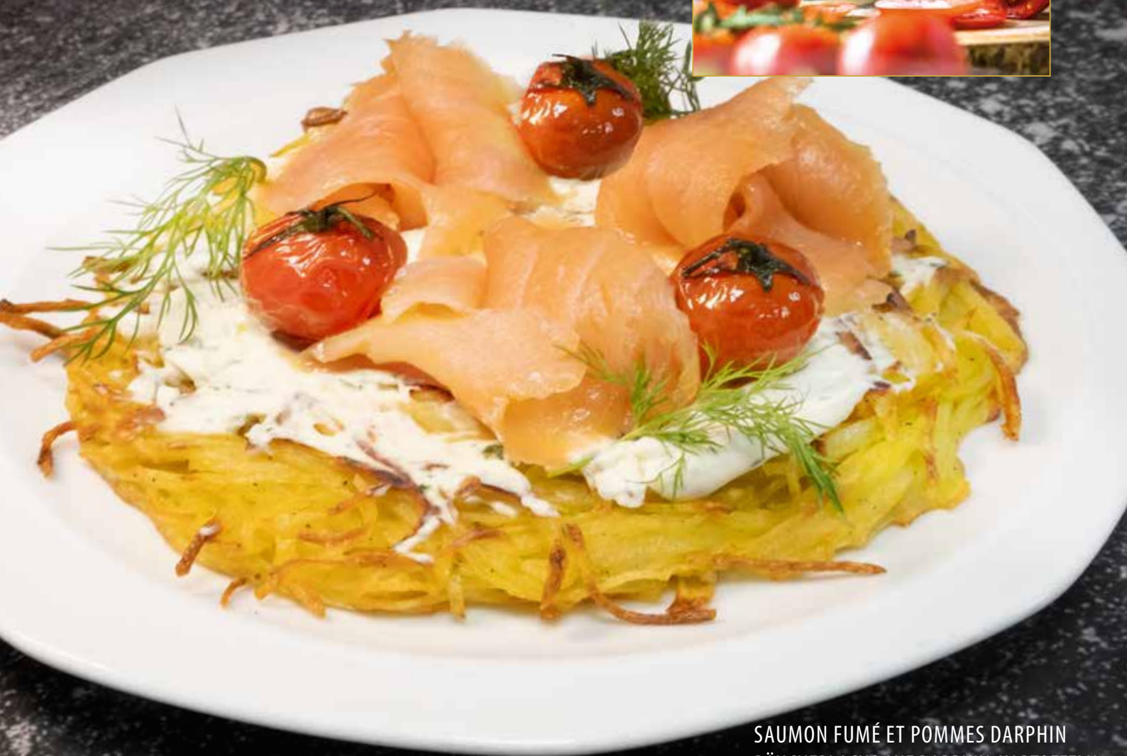
SAUMON FUMÉ ET POMMES DARPHEIN RÄUCHERLACHS AUF DARPHEIN-KARTOFFELN