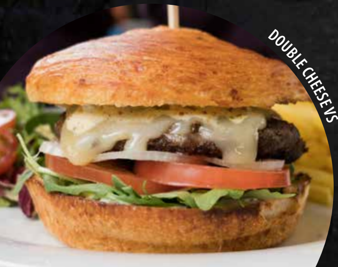
DOUBLE CHEESE VS

Buns maison Hausgemachte Buns 100% viande suisse 100% Schweizer Fleisch