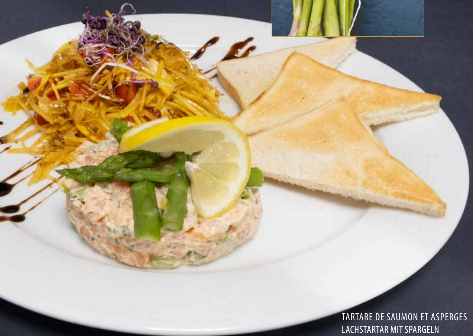
TARTARE DE SAUMON ET ASPERGES LACHSTARTAR MIT SPARGELN