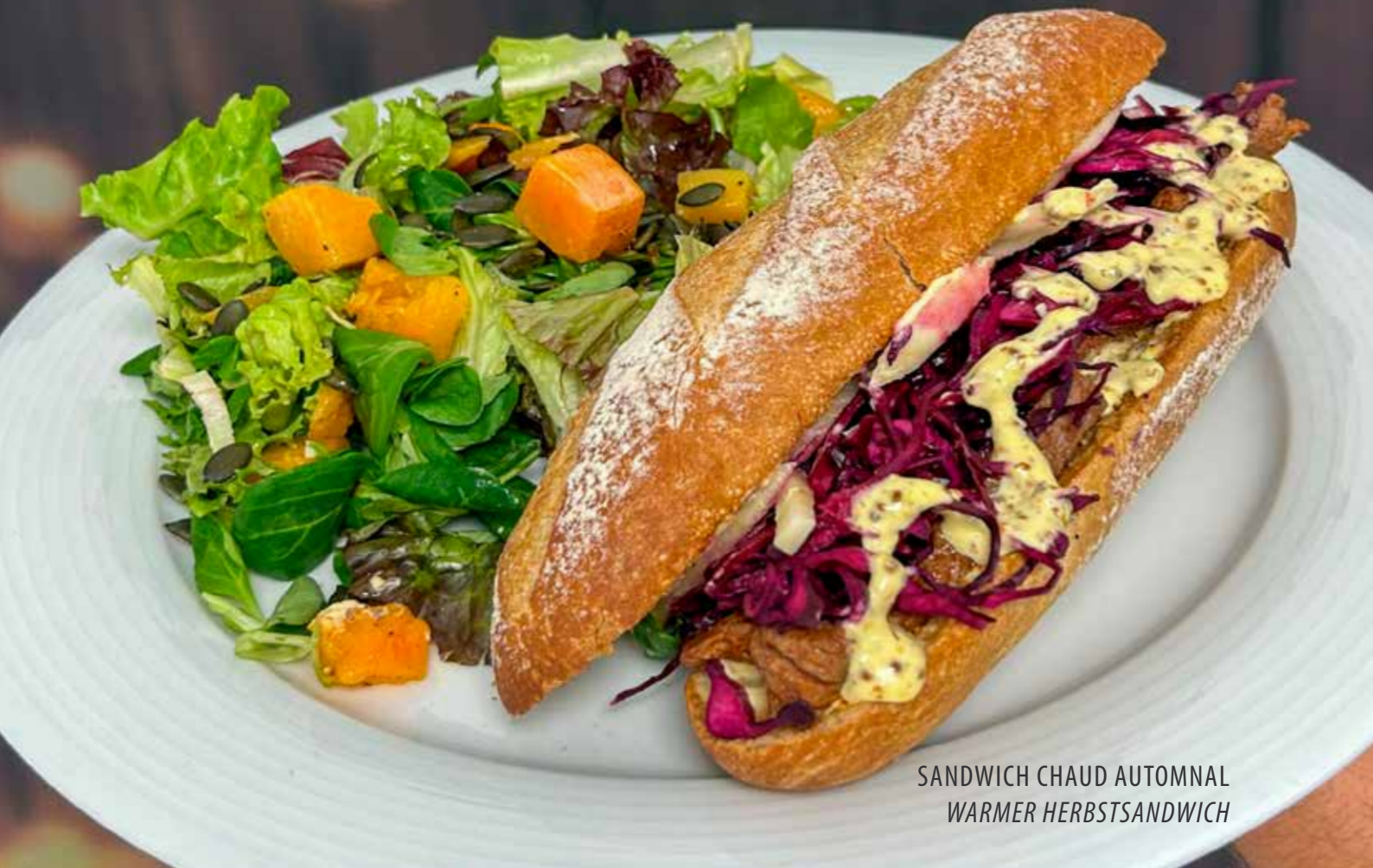
SANDWICH CHAUD AUTOMNAL WARMER HERBSTSANDWICH