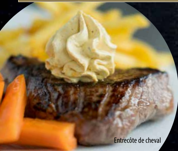
Entrecôte de cheval