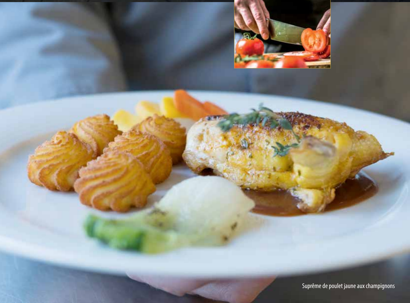
Suprême de poulet jaune aux champignons