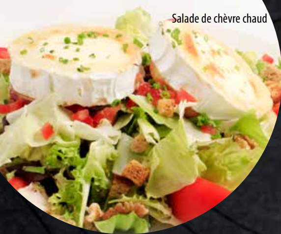
Salade de chèvre chaud