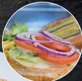
Burger pulled pork