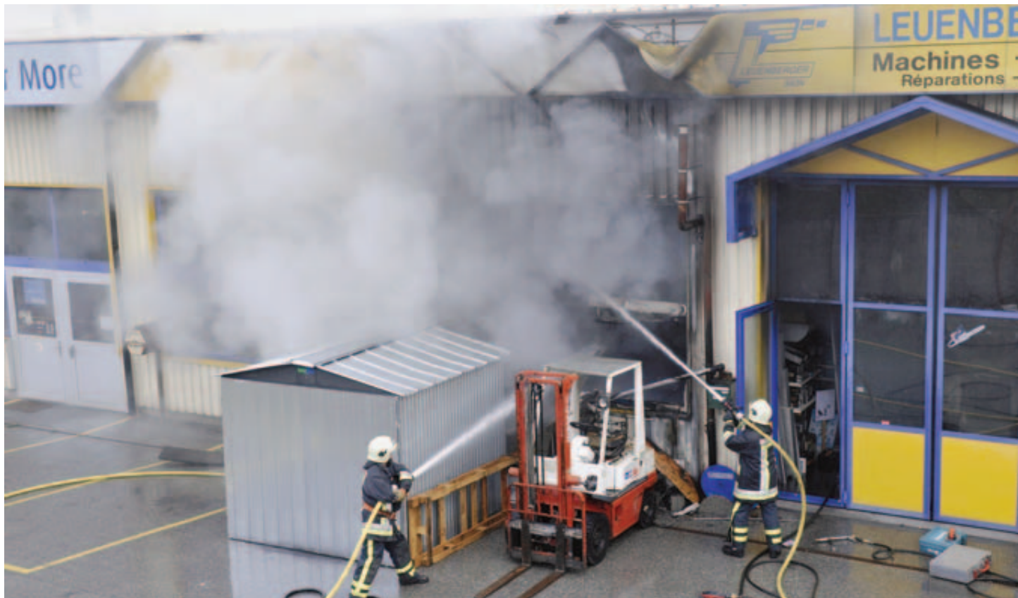
Les pompiers ont été confrontés à d'importantes flammes qui sortaient de la devanture du magasin. BITTEL