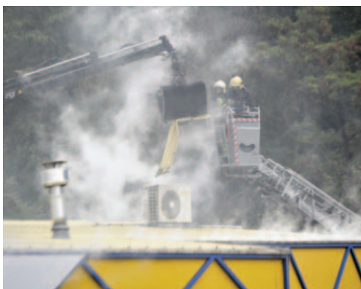
Les pompiers sont également intervenus sur la toiture afin d'éviter la propagation du feu par les éléments d'isolation. BITTEL